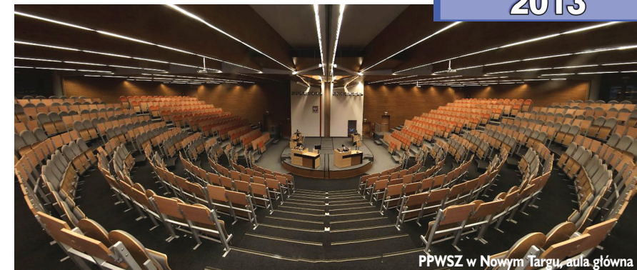
PPWSZ w Nowym Targu, aula główna

Konferencji w Sali Kolumnowej Sejmu towarzyszyła specjalnie przygotowana wystawa prezentująca zarówno dorobek 15-lecia PWSZ, jak i ich współczesne oblicze.